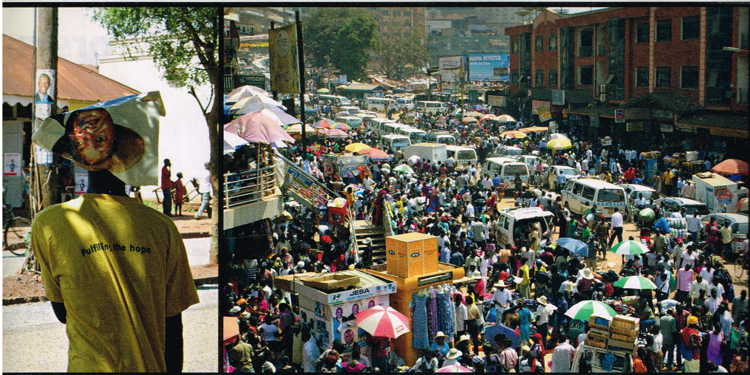
Fulfilling the hope? Valgkampanjene holdes jevnlig i ulike byer, ved at folk samles og holder store prosesjoner med livlig musikk og dans som verktøy. Markedet og busstasjonen i Kampala er som ett, og er like kaotisk hver dag.